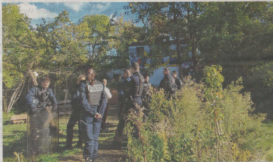
Plusieurs habitants sont venus contester les travaux engagés sur le jardin partagé Utop'île, sur l'île de la Dérivation, à Carrières-sous-Poissy. En vain. Florent JACONO

Sur ce terrain, un pylône de 7,5 m de haut doit voir le jour afin que s'érige un nouveau pont. Appelé pont d'Achères, cette construction de 2 x 2 voies de 32 m de large va permettre de relier la RD30 et la RD190,